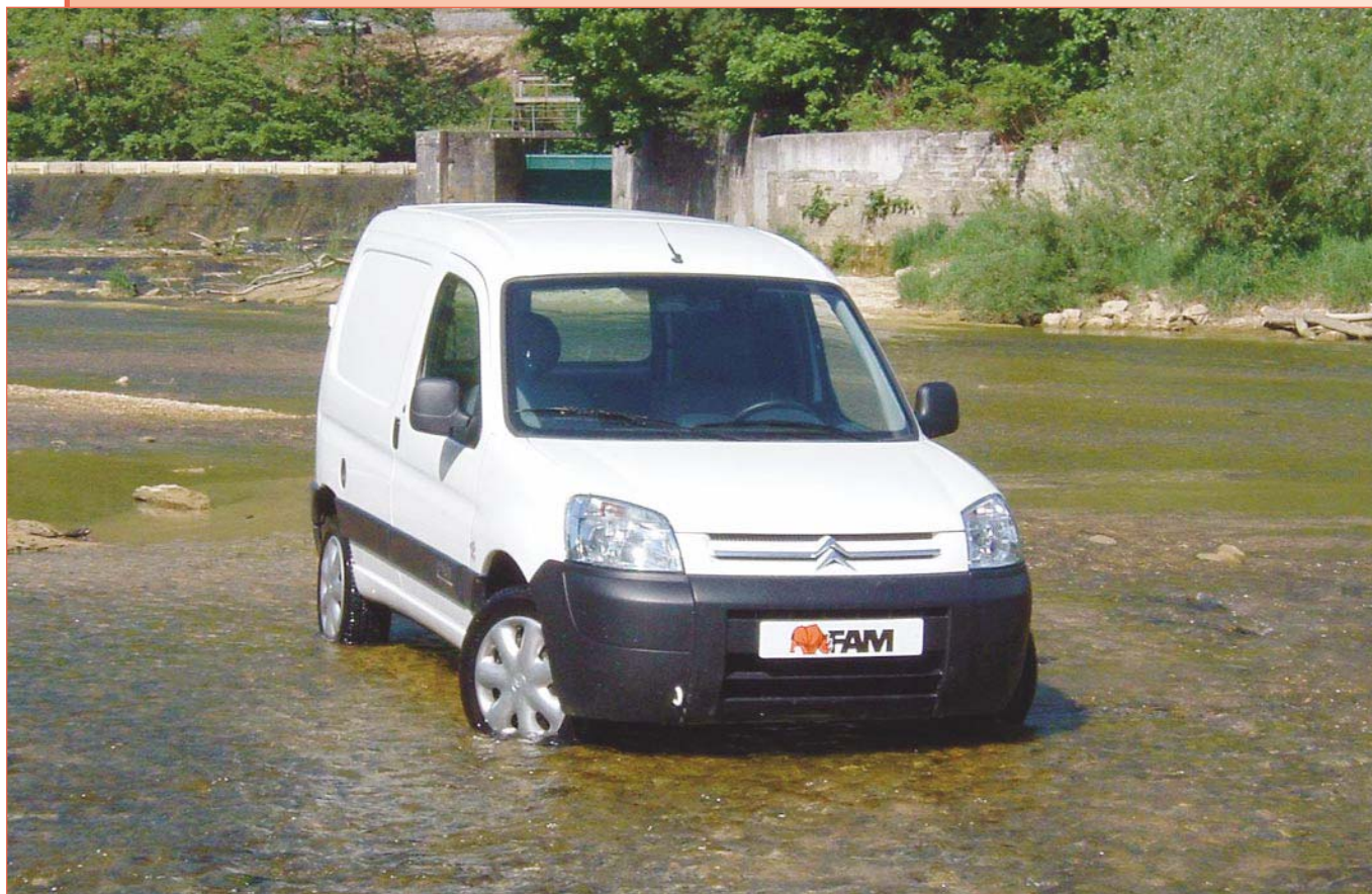
Transmission 4x2 à glissement limité